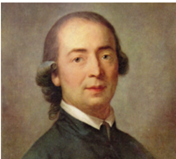
Johann Gottfried Herder (1744-1803)

bewahrt wird, auch wenn man erst nachschauen muss, um sie zu entdecken. Naturgemäß finden sich in neuerer Zeit kaum noch Dichter aus den alten, vergangenen deutschen Heimatgebieten. Umso wichtiger ist es, diese zu bewahren, weil sie sich durch eine unverstellte Glaubenszuversicht und reformatorische Klarheit auszeichnen. Darum möge zum Abschluss der Blick auf zwei weitere Ostpreußen fallen, die im Evangelischen Kirchengesangbuch verzeichnet sind. Das Epiphanius-Lied „Du Morgenstern, du Licht vom Licht“ (EG 74) des aus Mohrungen stammenden Johann Gottfried Herder (1744-1803), der als Hofprediger in Bückeberg wirkte und als Generalsuperintendent im Goethe'schen Weimar keinen leichten Stand hatte, ist ein Dank- und Trostlied in einer von der Aufklärung geprägten Zeit, das mit einer inständigen Bitte schließt: „Bleib bei uns, Herr, verlaß uns nicht, führ uns durch Finsternis zum Licht, bleib auch am Abend dieser Welt als Hilf und Hort uns zugesellt.“