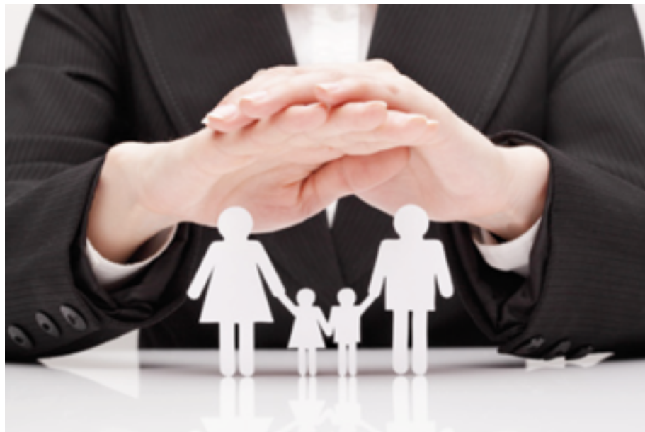
„Ehe und Familie stehen unter dem besonderen Schutze der staatlichen Ordnung“.

Der Gesetzgeber kann nicht die von ihm zu schützenden Güter umdefinieren