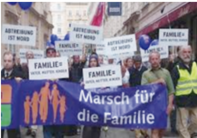
Marsch für die Familie

lichen biologischen und seelischen Anlage des Menschen.