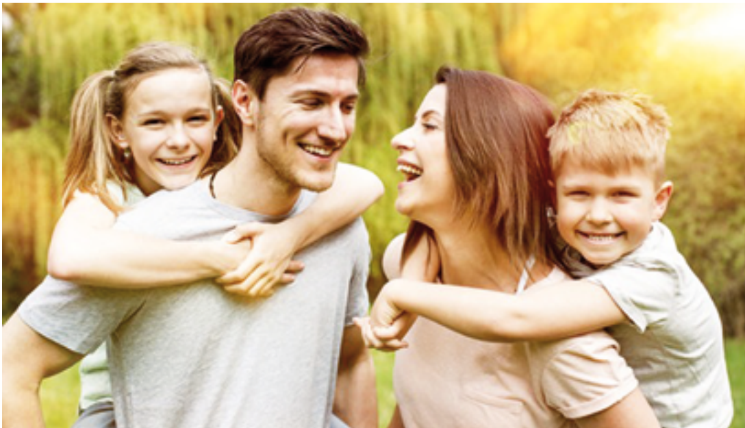
Familie – Keimzelle der Gesellschaft

tragung von Rechten, sondern um die Umdefinition dessen, was das Recht als ihm Vorgegebenes zu schützen hat.